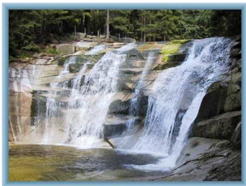
KRKONOŠE – MUMLAVA