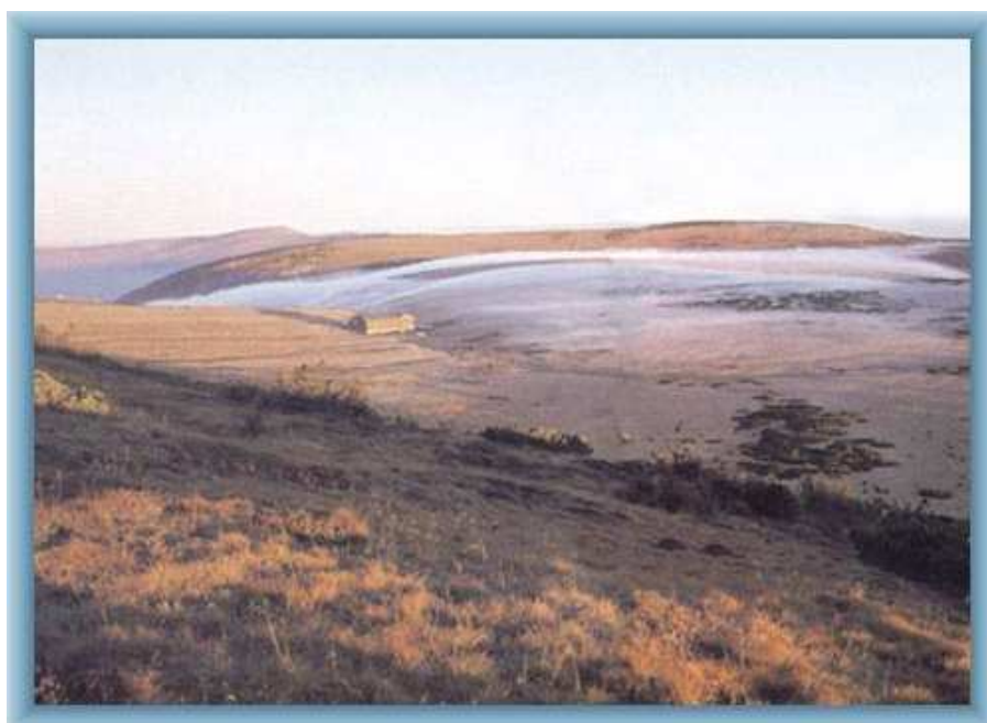
KRKONOŠE – LUČNÍ BOUDA