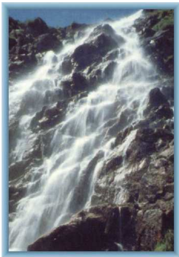
KRKONOŠE – LABSKÝ VODOPÁD