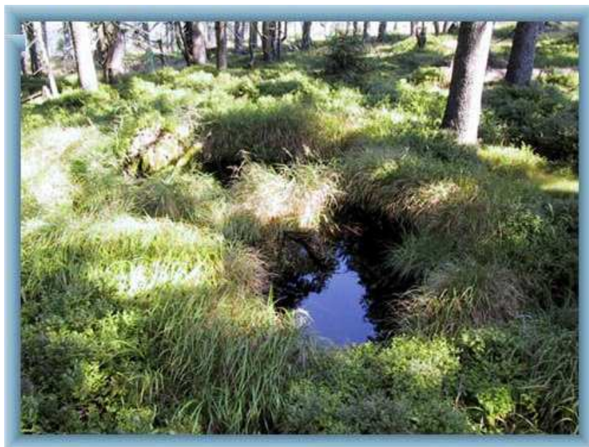
KRKONOŠE – ČERNOHORSKÉ RAŠELINIŠTĚ