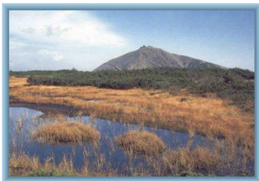
KRKONOŠE – SNĚŽKA