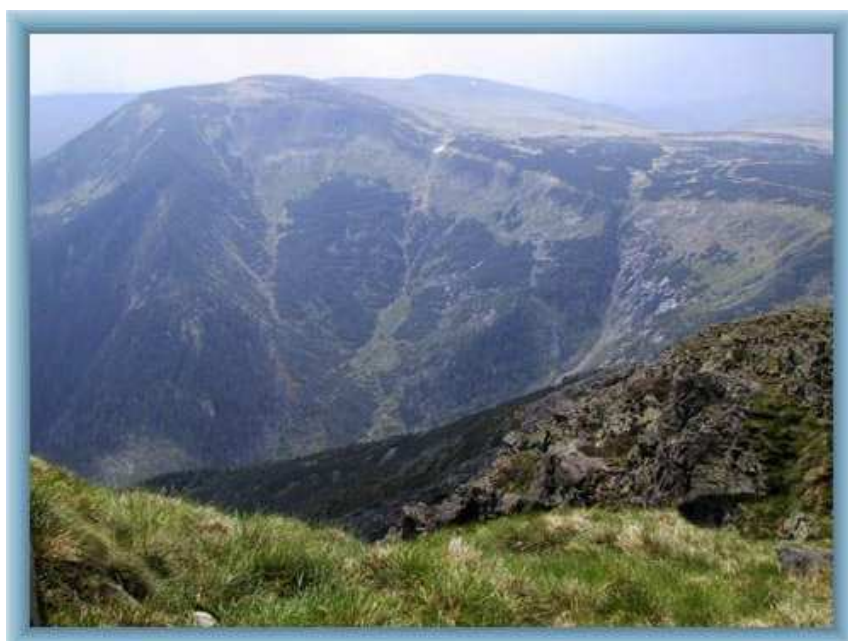
KRKONOŠE – OBŘÍ DŮL