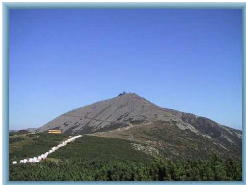
KRKONOŠE – SNĚŽKA